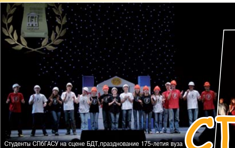
Студенты СПбГАСУ на сцене БДТ, празднование 175-летия вуза