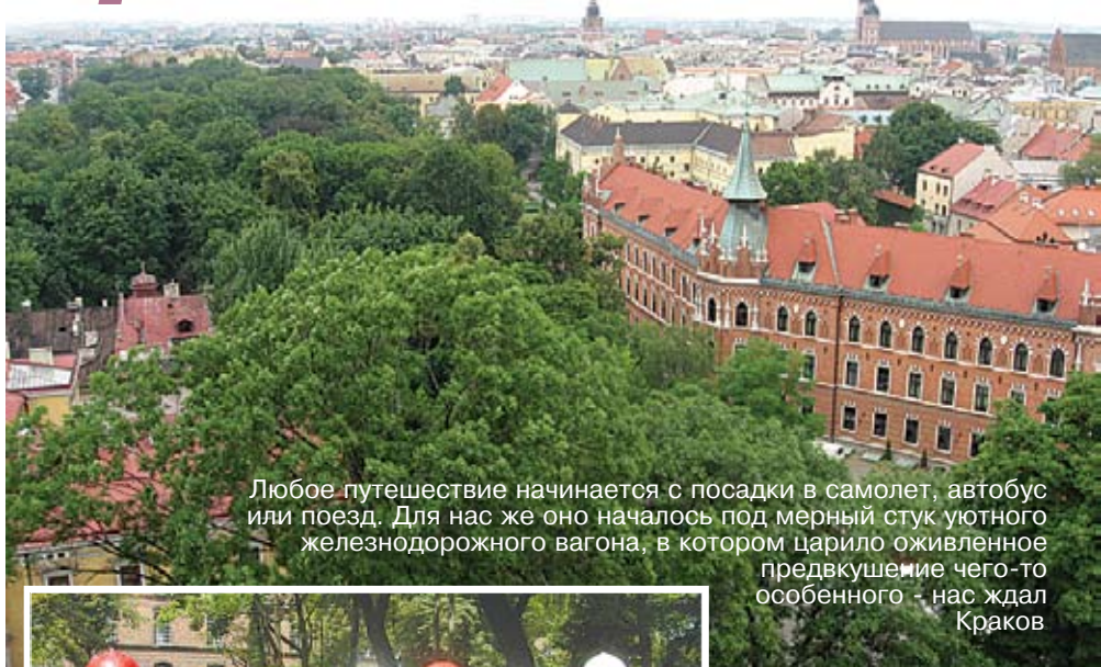
Любое путешествие начинается с посадки в самолет, автобус или поезд. Для нас же оно началось под мерный стук уютного железнодорожного вагона, в котором царило оживленное предвкушение чего-то особенного – нас ждал Краков

которая предпочла броситься в воды реки Вислы, нежели стать женою немецкого рыцаря. Или легенда о страшном драконе Смоке, хитроумно побежденном недалеко от своей пещеры у подножия Вавельского холма сыном короля Крака.