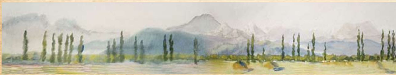
Картина Г. И. Мярса "Дорога на Владикавказ"

Грусть надежд и несыгранных песен, Грусть далекой манящей мечты Всё о том, чтобы мир был бы тесен От любви и земной красоты.