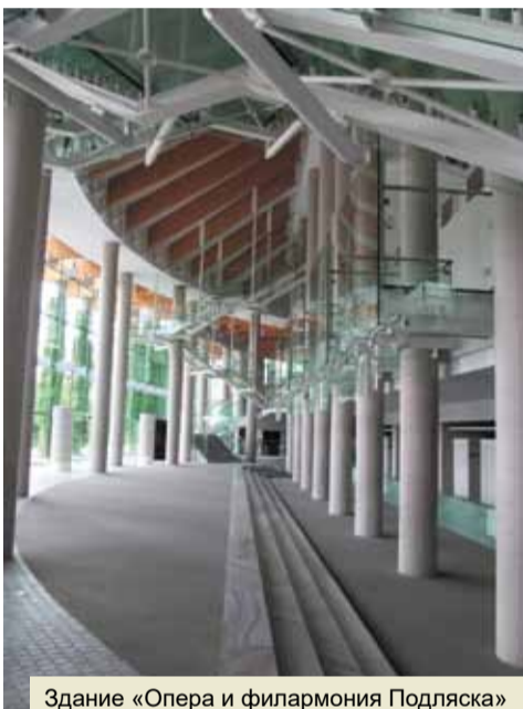
Здание «Опера и филармония Подляска»