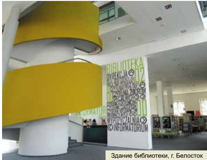
Здание библиотеки, г. Белосток

выполнен из дуба, и это не может не поражать... В храме есть три зала, где каждую неделю проходят службы, которые один из студентов польской группы посещает уже 11 лет, являясь прислужником. На территории храма находится дом для проживания работников, а также корт, на котором мы провели целый вечер, играя в теннис.