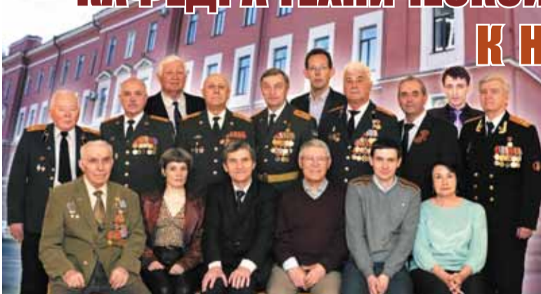
День Победы давно прошел, слова благодарности ветеранам сказаны, но в год 70-летия Великой Победы в начале нового учебного года хочется сказать и о тех, кто продолжает их традиции...

Можно смело предположить, что в СПбГАСУ не найдется дру-