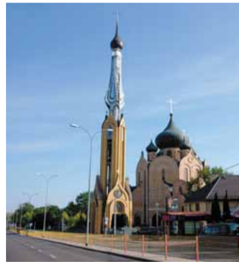
Церковь Сошествия Святого Духа, г. Белосток

Мы посетили и самый большой православный храм Польши — церковь Сошествия Святого Духа. Храму всего 30 лет (построен в 1984 году). Он был создан всецело на средства прихожан: даже его проектированием полностью занимался один из них! Иконостас