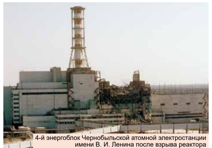
4-й энергоблок Чернобыльской атомной электростанции имени В. И. Ленина после взрыва реактора

тщательно скрывались. Ясно лишь то, что установить точное число умерших людей за истекший период не представляется возможным (независимые эксперты полагают, что счет может идти на десятки и даже сотни тысяч жизней). К военной истории данное событие имеет самое непосредственное отношение, т. к. основное число «ликвидаторов» последствий аварии (около 600 тыс. человек) было именно военнослужащими Советской армии и Внутренних войск СССР (подразделений МЧС в то время еще не существовало).