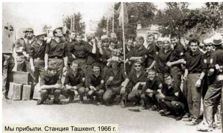
Мы прибыли. Станция Ташкент, 1966 г.

вращения в Ленинград «лисыята» не только выполнили поставленную задачу, но также своим трудом, подходом к работе завоевали уважение и авторитет. Не случайно, именно к ним обратилось руководство Минтрансстроя с просьбой задержать после 1-го сентября и закончить бетонирование фундамента под второй дом. И эта миссия была решена! В итоге, бойцам выделили специальный авиарейс для возвращения домой, а также наградили Орденом Трудового Красного Знамени. С такими успехами вернулись они в родной Ленинградский инженерно-строительный институт, где с гордостью рапортовали руководству вуза о выполненных задачах.