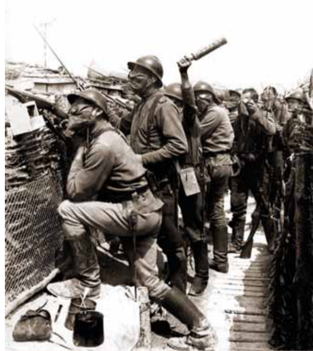
Солдаты Экспедиционного корпуса Русской армии в окопах на Западном фронте (Франция, 1916 г.)