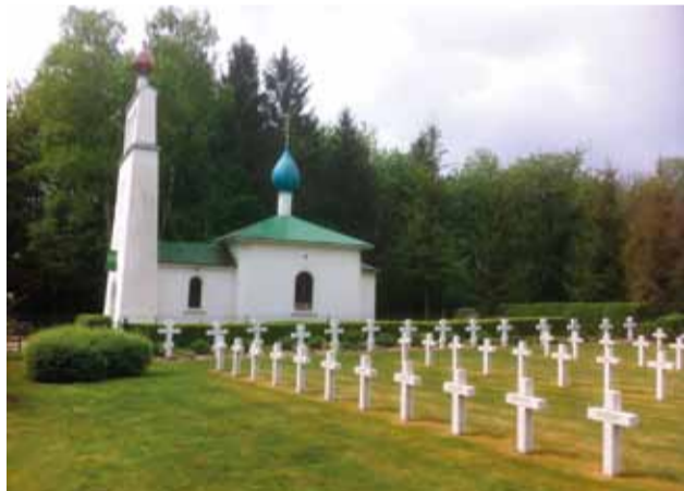
Могилы русских солдат на кладбище Сент-Илер-ле-Гран в провинции Шампань (окрестности Реймса).

Недоверие корпусу стали демонстрировать и союзники. После Октябрьского переворота, приведшего к власти в России большевиков, французское командование расформировало полки пехотных бригад Русского экспедиционного корпуса. Солдатам и офицерам предлагался выбор: либо продолжать сражаться в составе французских частей, либо отбыть в Алжир для работы на колониальных объектах и предприятиях. В конце 1917 г. из волонтеров Особых полков был создан Русский Легион Чести, объединивший под командованием полковника Г. С. Готуа (1871–1936) около 300 солдат и офицеров. Наступая в составе Марокканской дивизии от Парижа, русские легионеры прошли с боями Лотарингию, Эльзас, Саар и вошли в Гер-