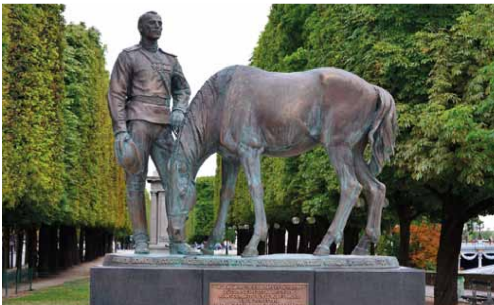
Памятник воинам Экспедиционного корпуса Русской армии, сражавшимся во Франции в 1916–1918 гг. (Париж)