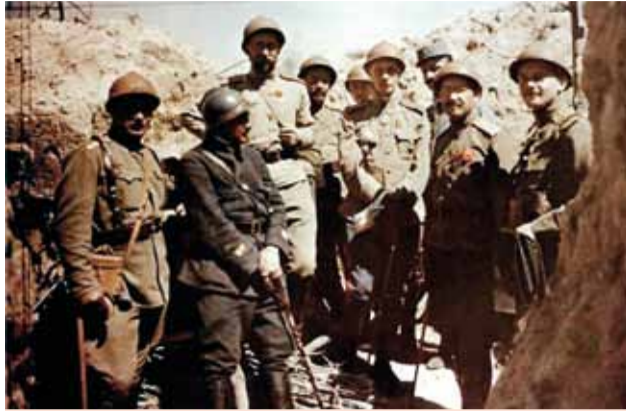
Русские и французские офицеры на позициях в провинции Шампань (лето 1916 г.)

манью, оккупировав город Вормс на Рейне. Велико было удивление и негодование немцев, узнавших в победителях русских солдат под бело-синим-красным знаменем (хотя русская армия в 1918 г. официально уже не существовала, легионеры продолжали носить свою форму со всеми знаками различия, наградами и погонами). Беспримерную доблесть русские легионеры проявили в сражении на реке Сомме в апреле 1918 г., а также в мае и сентябре 1918 г. в боях под Суассоном. Из первого состава легиона погибло более 85 % солдат и почти все офицеры. Накал боев был столь силен,