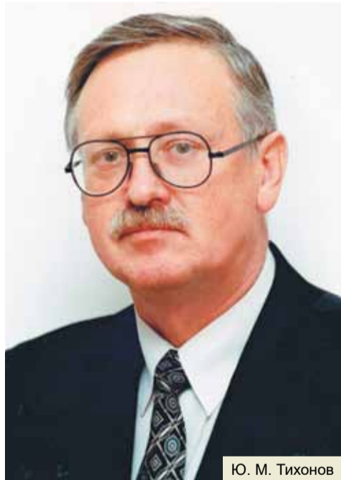
Ю. М. Тихонов