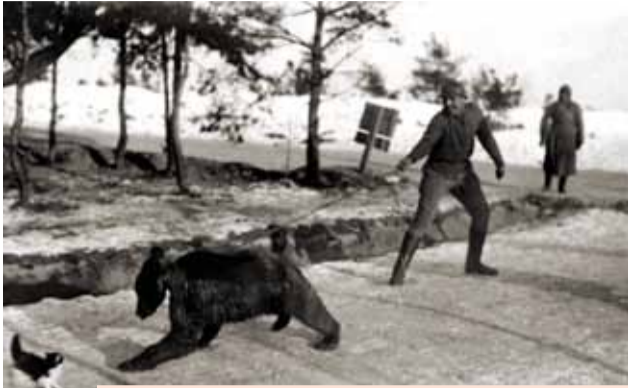
...на довольствии русской армии стоял настоящий русский медведь, привезенный солдатами из Сибири во время движения по Транссибу