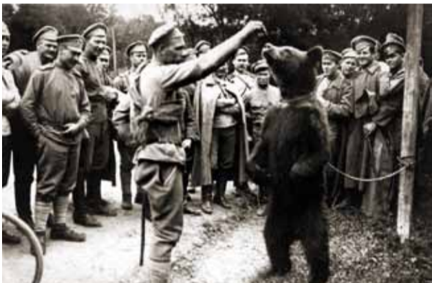
Мишка скрашивал досуг скучающих по Родине воинов, умел ходить на задних лапах и участвовал в построениях

комитетов (в России в это время бушевала стихия Февральской революции 1917 г. со всеми вытекающими последствиями: крах монархии, двоевластие Временного правительства и Советов, массовое дезертирство с фронта, разгул преступности и т. д.). Мятеж хотя и был подавлен своими же силами, боевой дух значительной части солдат упал. По некоторым данным, в ходе трехдневных боев около 600 солдат с обеих сторон было убито и ранено. Таким образом, еще до начала Гражданской войны в России это было первое боестолкновение русских солдат с русскими.