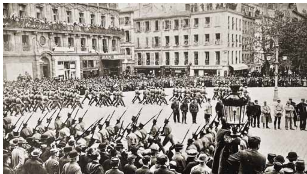
Высадка русских войск во Францию: прохождение церемониальным маршем по площади перед Марсельской префектурой (апрель 1916 г.)