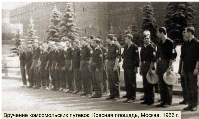
Вручение комсомольских путевок. Красная площадь, Москва, 1966 г.

Так началась работа — тяжелая, буквально в поте лица... Тем не менее, к концу августа, то есть ко времени планируемого воз-