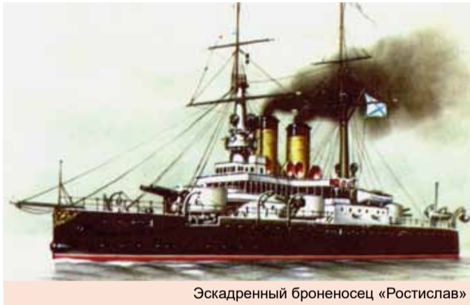
Эскадренный броненосец «Ростислав»

Несмотря на ожесточенное сопротивление турецких войск, их позиции захвачены, а коммуникации полностью разорваны (на Трапезундской дороге было разрушено шесть мостов). Далее в дело вступили морские тактические десанты: 4 марта пала оборона турок на р. Буюк-Дере, а 7 марта был взят портовый город Ризе. В обоих случаях действия морской пехоты поддерживал мощный огонь кораблей Черноморского флота Российской империи. В итоге, русские войска овладели 120-километровой зоной прибрежной территории Османской империи. Дальнейшее их продвижение было перекрыто высокими горами Понтийского Тавра. Остро встал и вопрос о необходимости переброски подкреплений. По запросу Н. Н. Юденича император Николай II (1894–1917) распорядился перебросить резервы с Австро-Венгерского фронта две кубанские пластуны бригады и два ардизивизиона общей численностью в 18 тыс. человек. Переброска войск — из Одессы до Новороссийска, а от туда в Ризу — была осуществлена силами