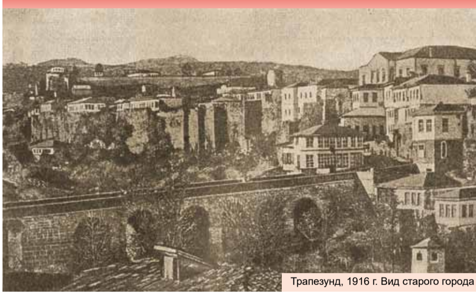
Трапезунд, 1916 г. Вид старого города

Апрельский выпуск «календаря» памятных дат военной истории России посвящен трем событиям, годовщины которых имеют не только важное историческое значение, но и юбилейный характер своей давности.