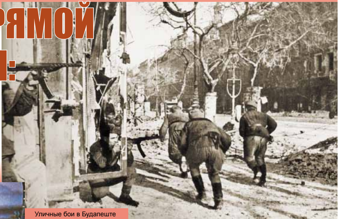
Уличные бои в Будапеште