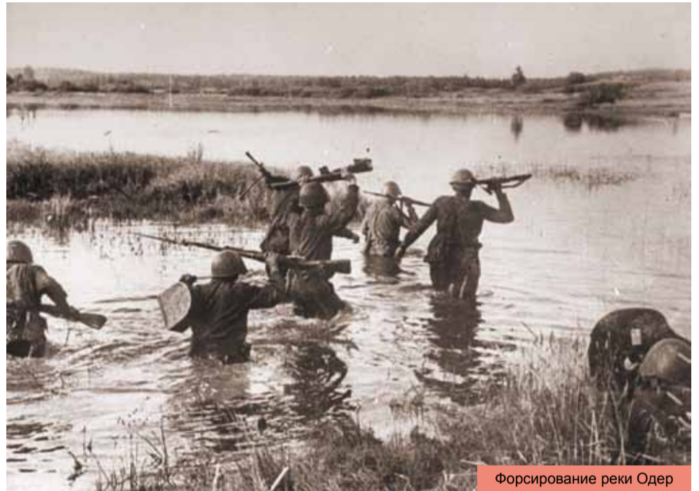
Форсирование реки Одер

деяний; а также о присоединении части территории Восточной Пруссии к СССР. По согласованию сторон, непременным условием сохранения германского государства было полное искоренение нацизма и шовинистического милитаризма. Важное значение приобрели вопросы о проведении в послевоенный период 1-й Конференции ООН, а также о необходимости вступления СССР в войну против Японской империи и оккупации советскими войсками территории Северной Кореи до 38-й параллели. За освобождение от японских войск континентальной части Азии советская делегация получила гарантии о признании территориального присоединения к СССР островов Курильской гряды и Южного Сахалина, отторгнутого Японией у Российской империи по Портсмутскому миру 1905 г. После подписания итогового протокола, конференция прекратила свою работу 11 февраля 1945 г. Следует отметить, что все решения, как и на первой Тегеранской конференции 1943 г., принимались непосредственно главами делегаций: И. В. Сталиным — Генеральным секретарем ЦК ВКП (б), Председателем Государственного Комитета обороны СССР, Председателем Совета народных комиссаров СССР, Ф. Рузвельтом — Президентом США, и У. Черчиллем — Премьер-министром Великобритании.