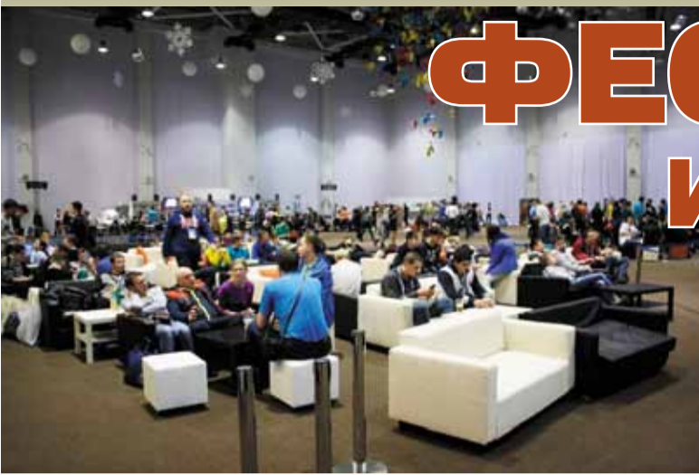
25 января завершился XXVI Международный фестиваль команд КВН. Для ребят, представляющих наш университет, он завершился более чем успешно! Команда «Лакмус» получила необходимый рейтинг, чтобы играть в региональных лигах, а команда «Парк Победы» — повышенный рейтинг и право играть в центральных лигах МС КВН.

Возможно, не всем известно, но фестиваль «КиВиН» в Сочи является своего рода Меккой для кавээнщиков. Именно на это мероприятие ежегодно съезжается огромное количество команд, чтобы соревноваться в острологии. В этом году и нашим ребятам из коллектива «Парк Победы» выпал превосходный шанс себя проявить.