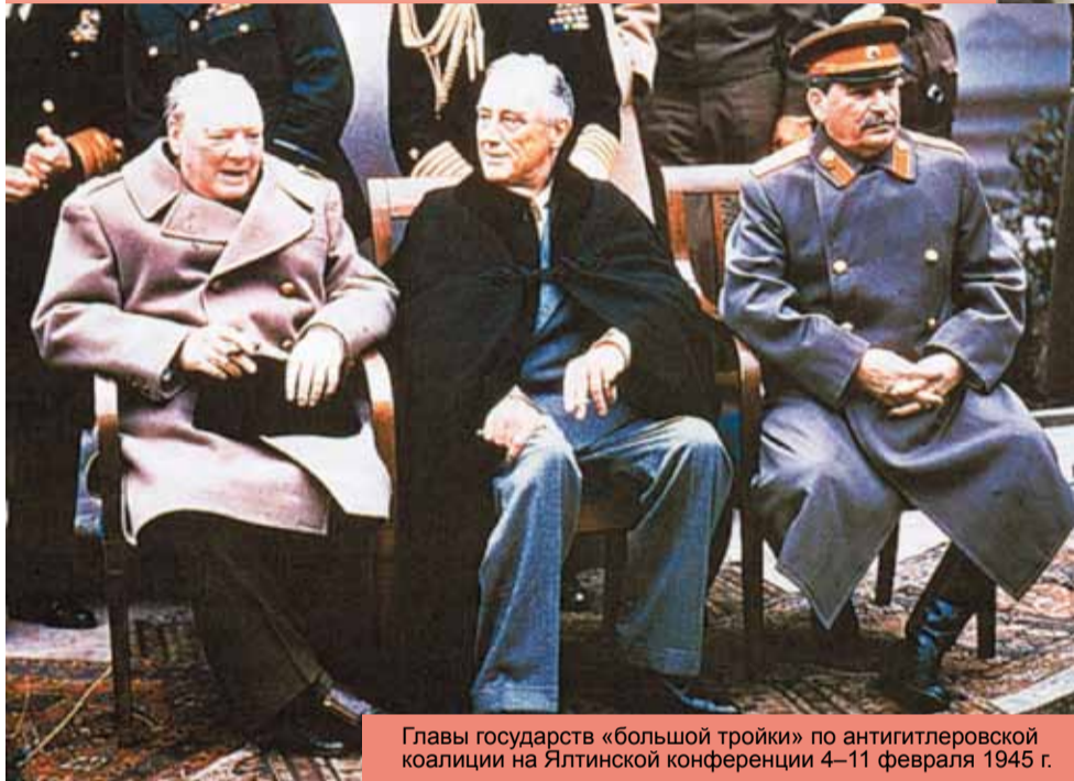
Главы государств «большой тройки» по антигитлеровской коалиции на Ялтинской конференции 4–11 февраля 1945 г.

Гитлеровская Германия агонизировала. Хребет ее военного могущества был слоан Красной Армией еще в 1943 г., когда были одержаны эпохальные победы в Сталинграде и на Курской дуге. В 1944 г. врага полностью выбили с территории СССР, и война переместилась на Запад.