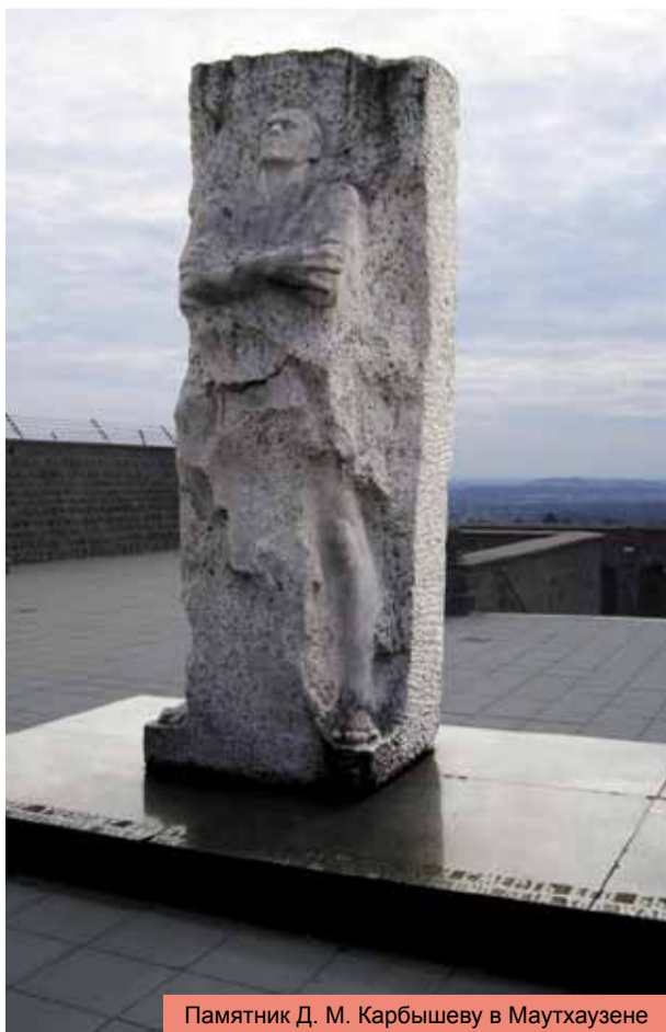
Памятник Д. М. Карбышеву в Маутхаузене

леровской коалиции. На заседаниях, проходивших в восстановленном после немецкой оккупации Ливадийском дворце — бывшей императорской резиденции Романовых — рассматривались судьбоносные вопросы послевоенного устройства мира. Среди них, в непростых переговорах решалась дальнейшая судьба Германии, восстановление государственности Польши, Чехословакии, Австрии, Югославии и других государств центральной Европы, в 1938–1940 гг. упраздненных Гитлером. В частности, была достигнута договоренность о разделе Германии на оккупационные зоны, причем, по предложению СССР, к странам-победительницам добавлялась и Франция; о репарациях, 50 % которых причитались Советскому Союзу, как наиболее пострадавшему от вражеских зло-