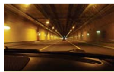
Ствол и рамповый участок подводного автодорожного тоннеля (С-1) в створе дамбы по защите Санкт-Петербурга от наводнений (введен в эксплуатацию в 2010 г.)