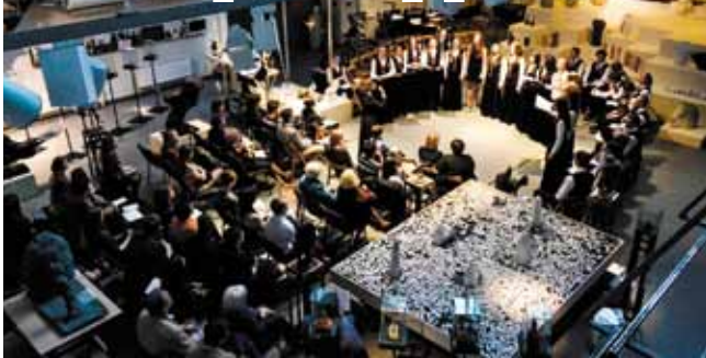
7 мая в мастерской Михаила Константиновича Аникушина состоялся концерт Камерного хора СПбГАСУ «Мы помним — мы гордимся!», посвященный 70-летию со Дня Великой Победы...

По случаю празднования 9 мая Камерный хор СПбГАСУ подготовил для ветеранов удивительный сюрприз! В уникальном доме-мастерской М. К. Аникушина был проведен концерт: здесь прозвучали литературно-музыкальные композиции о войне, затронувшие зрителей до глубины души. Мы благодарны ветеранам за Победу и мирное небо над головой! Спасибо нашему замечательному хору за проникновенный концерт и праздничную атмосферу!