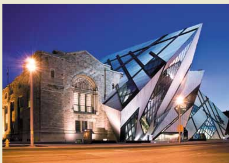
Королевский музей Онтарио является одним из самых необычных зданий в Торонто. Началось все в 1857 году, когда в училище, готовящем будущих преподавателей школ и колледжей, появилась небольшая коллекция произведений искус-

ства... На сегодняшний день, это не просто склад древностей, а целый учебный центр для юного поколения: ребят часто приводят сюда на уроки и экскурсий их преподаватели. И это не случайно: здесь собрано огромное количество вещей, которые необходимо сохранить для будущих поколений. Это останки древних динозавров и азиатские ковры, оружие и картины знаменитых европейских художников, древние вазы и статуи Будды, а также многое другое.