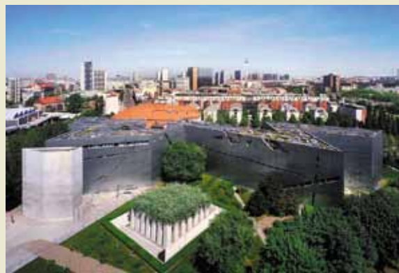
Еврейский музей в Берлине когда-то превратил Даниэля Либескинда в мировую знаменитость. Он позволяет посетителям на некоторое время отвлечься от повседневности и погрузиться в сложную эпоху Второй мировой войны.

Покорил конкурсную комиссию проект в первую очередь своей дешевизной. Изначально Еврейский музей планировался как филиал краеведческого музея Западного Берлина, и лишних денег на его создание у администрации не было. К тому же имелся целый ряд жестких технических условий, которые для многих проектировщиков стали непреодолимым препятствием, а Даниэль Либескинд разрешил их чуть ли не играючи. В частности, необходимо было объединить новое здание с основным, которое являлось архитектурным памятником XVIII века, и не исказить, при этом, внешний вид великолепного дворца эпохи барокко. Архитектор решил задачу довольно просто: он сделал между обоими зданиями невидимый снаружи подземный переход. Чтобы удлинить путь вдоль экспозиции, здание выполнено в плане зигзагообразным. В этом зигзаге многие сразу устремились сломанную звезду Давида — символ трагической еврейской судьбы.