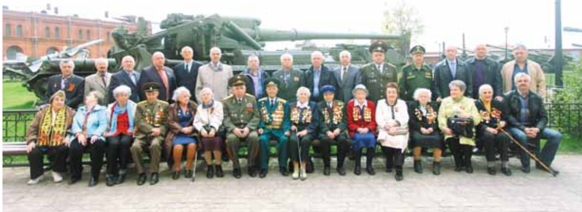
7 мая Военно-исторический музей артиллерии, инженерных войск и войск связи собрал участников Объединенного совета ветеранов инженерных войск однополчан Ленинградского и Волховского фронтов...

История этой ветеранской организации имеет глубокие корни: она была инициирована более пятидесяти лет назад! По окончании Великой Отечественной войны ежегодно стали собираться ветераны 106 отдельного моторизованного инженерного батальона 2 Ударной Армии. Многие бойцы его погибли в сражениях, и те, кто выжил, поклялись не забывать павших товарищей. Так, в 1968 году бывшие однополчане на свои собственные средства установили обелиск на Сиявинских высотах, содействовали в организации поисковых работ погибших. Начиная с той поры, ветераны приезжали к обелиску дважды в год, чтобы почтить память не вернувшихся с войны друзей (9 мая и 12 августа — в день штурма Сиявинских высот).