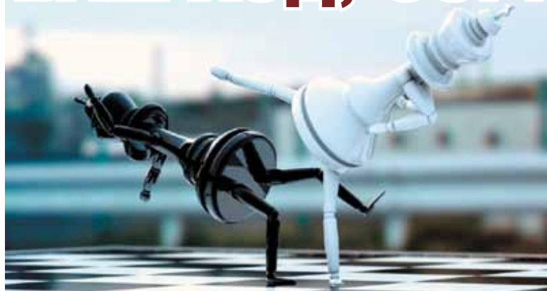
27–28 апреля проходил чемпионат Санкт-Петербурга среди студентов высших учебных заведений по шахматам. В упорной борьбе команда СПбГАСУ заняла седьмое место.