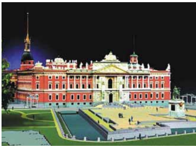
Реконструкция Государственного русского музея

— Во всех проектах я стараюсь придумать что-то новое, — говорит Олег Сергеевич, — Я считаю, что архитектура, кроме решения эстетических задач, должна нести в себе элементы изобретательности. Например, Росси изобрел чугунные арки и чугунные колонны.