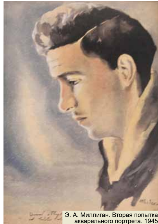
Э. А. Миллиган. Вторая попытка акварельного портрета. 1945