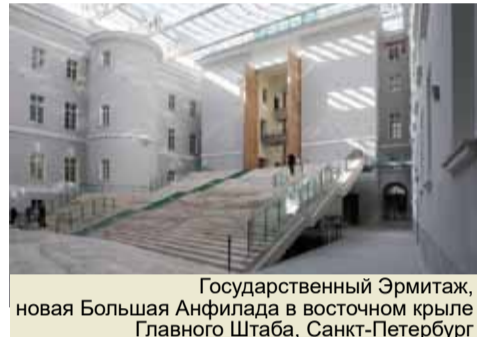
Государственный Эрмитаж, новая Большая Анфилада в восточном крыле Главного Штаба, Санкт-Петербург

Музейный комплекс Государственного Эрмитажа в восточном крыле Главного Штаба. В 2014 году Н.И. Явейн блестяще справился с непростой задачей: реконструкцией Главного Штаба Эрмитажа. Идеология реконструкции выражена из архетипов этого исторического музея — его анфиладных построений, барочных перспектив, висячих садов и больших выставочных залов, освещенных верхним светом. Возрождение этих принципов на новом витке развития Эрмитажа призвано обеспечить культурную преемственность и родство образов старого и нового музея.