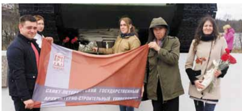
Солнечным и одновременно дождливым днем 6 мая 2017 года состоялся ежегодный автопробег секции автоспорта СПбГАСУ, посвященный Дню Победы в Великой Отечественной войне.

Мероприятие включало в себя посещение музея-диорамы «Прорыв блокады Ленинграда» и возложение цветов к памятникам Невского пятачка, являющегося одним из символов беспримерного мужества и героизма защитников Родины.