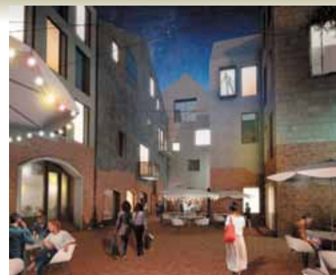
Конкурсный проект концепции развития территорий исторического центра города Калининграда. Новый город на руинах старого

Академия танца Бориса Эйфмана. Внутреннее атриумно-игровое пространство восходит к архетипу школьного двора закрытого учебного заведения. При этом его компоновка не имеет ничего общего с классической иерархией и симметрией. Расположенные на различных высотных отметках, залы и рекреации, по образному выражению Никиты Явейна, «пляшут в пространстве». Воедино их связывает развитая система коммуникаций — лестницы, лифты, переходные галереи. В каждое помещение можно попасть различными путями. По мысли авторов проекта, сетевая модель организации пространства с ее гибкой вариативностью будет способствовать внутреннему раскрепощению учащихся, побуждать их к творческому эксперименту. Фасад бывшей «Ассамблеи» восстановлен в соответствии с авторским замыслом 1911 года.