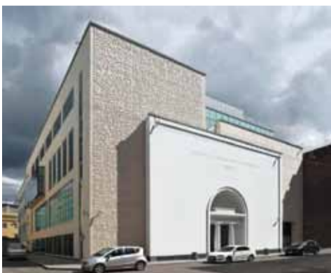
Академия танца под руководством Бориса Эйфмана. Главный фасад

История мировой архитектуры развивается скачкообразно, так как в значительной мере зависит от технологий и социальных потребностей. Стиль сменяет стиль, равно как и их лидеры. Имена их известны: Ле Корбюзье, Мис Ван дер Роз, Френк Гери, Заха Хадид.