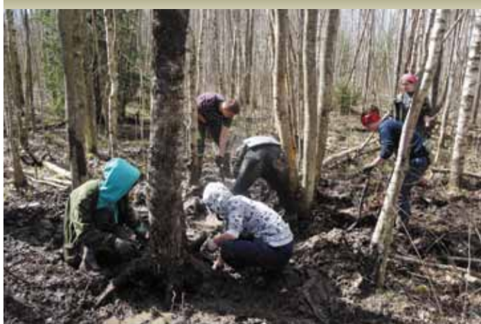
Гайтолово. Синявинские высоты. Здесь шли одни из самых ожесточенных боев на Ленинградском фронте. Попадая в эти места сейчас, через 75 лет после начала Великой Отечественной войны, удивляешься, как недавно все это было. Снаряды, осколки, котелки, каски, патроны, оружие... Земля перемешана с металлом, часто все это лежит на поверхности...

Именно такие эмоции вызвал у ребят из Студенческого археологического отряда САО Линь первый выход на поисковые раскопки в конце апреля. Никогда еще война не была так близко.