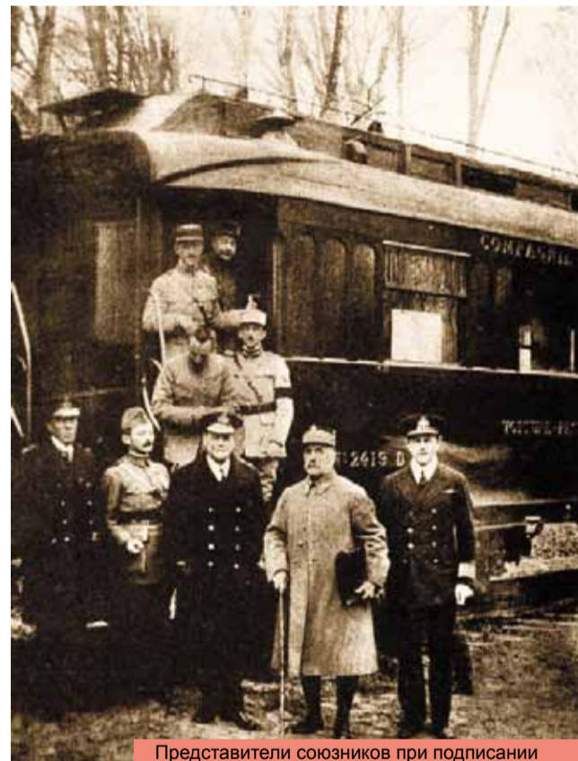
Представители союзников при подписании Компьенского перемирия 11 ноября 1918 г. Маршал Ф. Фох (второй справа) возле своего вагона в Компьенском лесу