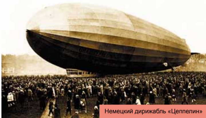
Немецкий дирижабль «Цепелин»