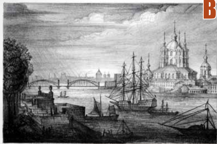
А. Королева, 4-А-IV Смоленский собор. Литография. 2013 год. ДВС.

Выставка «Офорт и Литография» ориентирована на раскрытие студентам-архитекторам уникальности эстампа как средства коммуникативного общения, применяемого мастерами графиками и зодчими в изобразительном искусстве и архитектуре. Она освещает мало исследованную тему: «Применение печатных техник в архитектурной графике». Термин архитектурная графика включает все типы изображения архитектуры — технические (чертеж, эскиз, демонстрационный чертеж с элементами рисунка) и художественные изображения (А. В. Иконников).