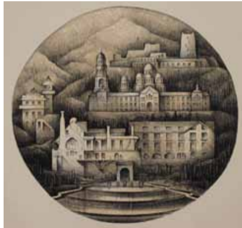
М. Быстрицкая, 2-PPAN-V Достопримечательности г. Сухуми. Литография. 2014. Кружок «ЛИТО-2».

В течение семестра, по выбранному направлению «ДВС» студентам необходимо сделать на основе композиционного эскиза итоговую работу в материале. В эскизе выстраиваются взаимовлияния между формальной композицией рисунка и информацией об архитектурной композиции изображаемого мотива.