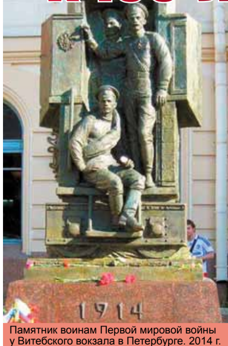
Памятник воинам Первой мировой войны у Витебского вокзала в Петербурге. 2014 г.