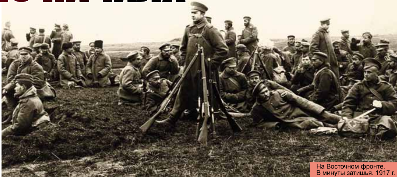
На Восточном фронте. В минуты затишья. 1917 г.

Все думали, что конфликт продлится несколько месяцев, но война затянулась на 4 года и 3,5 месяца. В ней приняли участие 38 государств с населением 1,5 млрд человек: ни много ни мало две трети всего населения планеты в то время. Было мобилизовано и поставлено под ружье 74 млн человек. Больше других призвали на военную службу Россия (16 млн) и Германия (13 млн). Только военные потери всех стран-участниц в этой войне составили 10 млн убитых и погибших от ран, еще 10 млн человек умерли от голода и эпи-