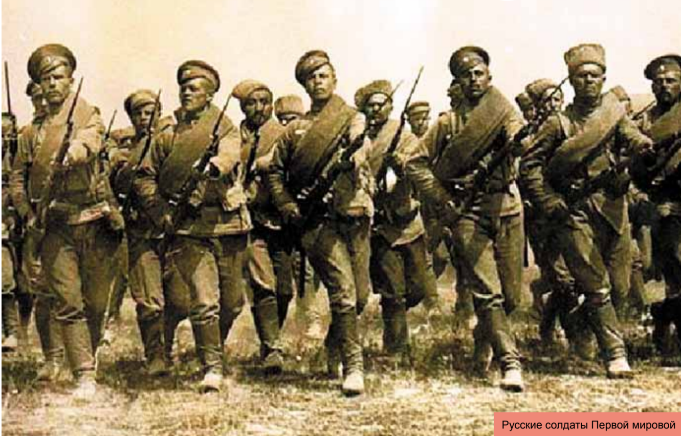
Русские солдаты Первой мировой