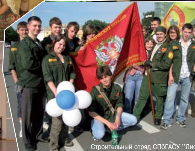
Строительный отряд СПбГАСУ "Лис"