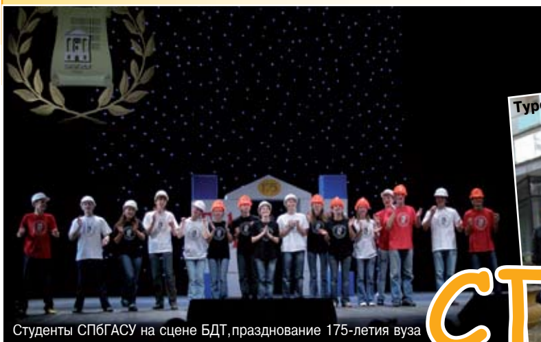
Студенты СПбГАСУ на сцене БДТ, празднование 175-летия вуза