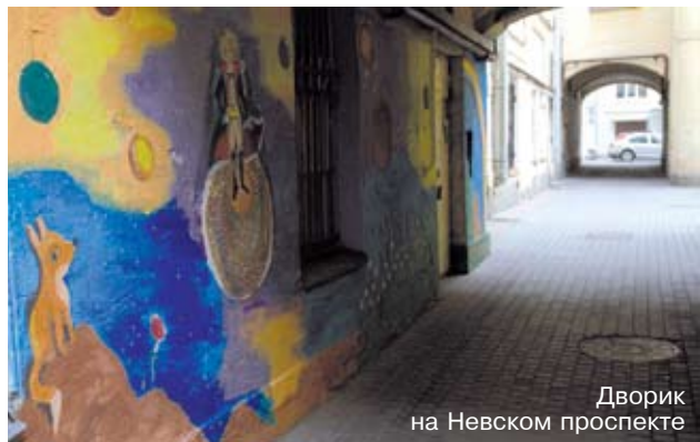
Дворик на Невском проспекте

Антуана де Сент-Экзюпери призвали в армию. Он выбрал авиацию. ...Молитвенная скамеечка, обтянутая потертым красным бархатом, кувшин с горячей водой, мягкая постель, любимый зеленый стульчик, который он повсюду таскал за собой, ища по замку мать, старый парк — все это снилось ему в Париже, а в аэропорту Кап-Джуби, зажатом песками Аравийской пустыни, как-то забылось. Он спал на двери, положенной на два пустых ящика, писал и ел на перевернутой бочке, читал при свете керосиновой лампы и жил в ладу с собой — для внутреннего равновесия ему были необходимы ощущение постоянной опасности и возможность совершить подвиг.