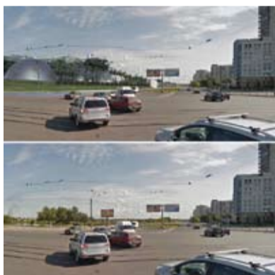
Перекресток улицы Димитрова и Бухарестской улицы