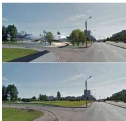
Перекресток Бухарестской улицы и Южного шоссе