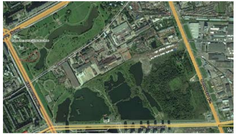
Участок в нынешнем состоянии (территория карьеров)

Едва взявшись за эту задачу, мы в полной мере ощутили, сколь она сложная и проблемная. Архитектурный аспект зоостроительства малоизучен: свежих прикладных исследований на эту тему в России нет, зарубежом их единицы. Да что