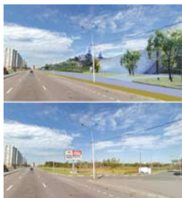
Перекресток Софийской улицы и улицы Димитрова