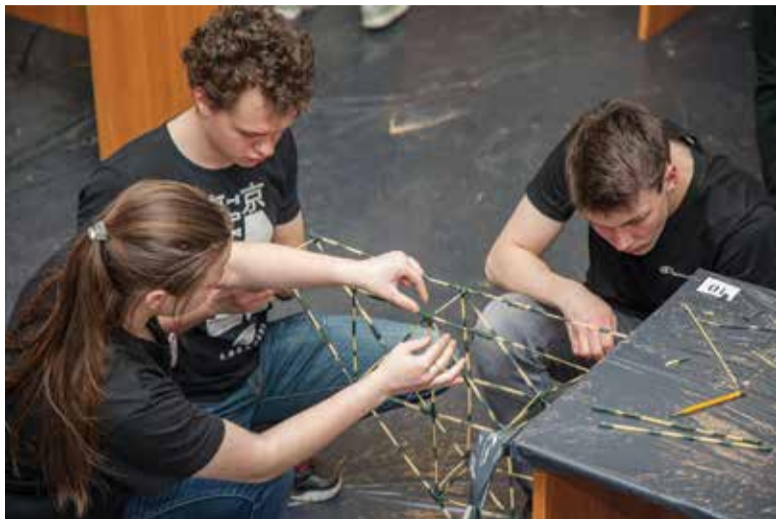
В одиннадцатый раз в СПбГАСУ прошел Международный конкурс «Макаронный строитель-2018». На этот раз командам не хватило 150 пачек макарон.

«Макаронный строитель» — это один из самых масштабных студенческих проектов, реализуемых в нашем университете. Каждый год он собирает команды из вузов, расположенных в самых разных городах нашей страны, а также из Беларуси. В этот раз наш университет принимал команды из БНТУ, МГАСК, БГТУ им. Шухова, ТвГТУ, ВоГУ, УГНТУ, САФУ им. Ломоносова, МГТУ им. Носова, АГТУ, ТИУ, МАРХИ, команды из СПбГПУ Петра Великого, ПГУПС императора Александра I и двух петербургских школ — №109 и №87.