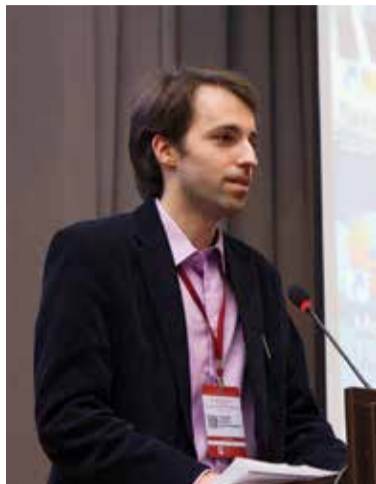
В России принята программа «Цифровая экономика Российской Федерации». Частью цифровой экономики являются BIM-технологии, которые все активнее используются в архитектуре и строительстве.

29–30 марта 2018 года в СПбГАСУ прошла Всероссийская научно-практическая конференция «BIM-моделирование в задачах строительства и архитектуры». Научный форум собрал ученых, работающих в сфере BIM-технологий из МГСУ, Уральского федерального университета имени первого президента России Б. Н. Ельцина, Санкт-Петербургского Политехнического университета Петра Великого, других вузов.