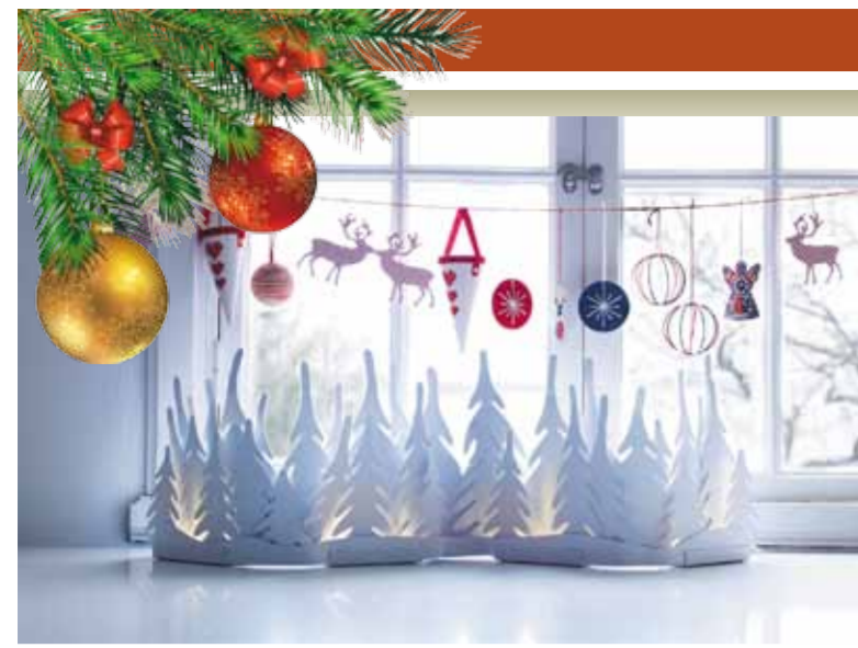
Наступление нового года ждут все! Новогодние торжества — это самая любимая пора людей всех возрастов. Но для того, чтобы празднование было удачным, к нему необходимо тщательно подготовиться.