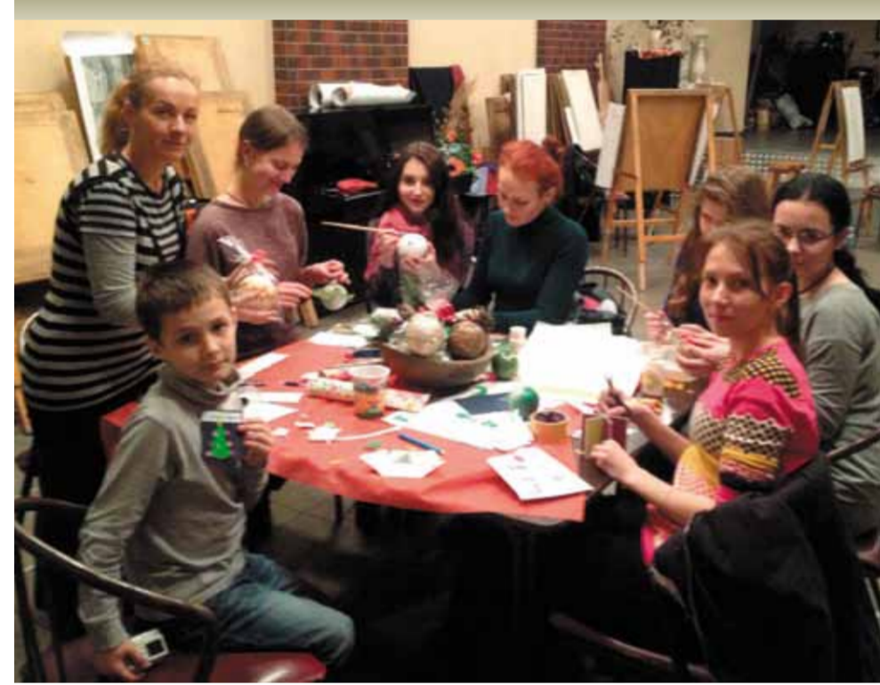
Ребята из творческой мастерской Центра студенческого досуга и творчества «Кирпич» полны новыми идеями и задумками. Здесь регулярно проводятся мастер-классы на самые разнообразные темы. Каждый может проявить себя как в чем-то уже знакомом, так и начать осваивать новый тип декоративно-прикладного искусства или прием в живописи и рисунке. Студенты активно осваивают новые техники, делятся опытом друг с другом.

Не удивляйтесь, но место празднования значения не имеет! Каждый может выбрать его по-своему: одни решат отметить Новый год дома, другие — в кругу друзей, третьи поедут за город шумной компанией