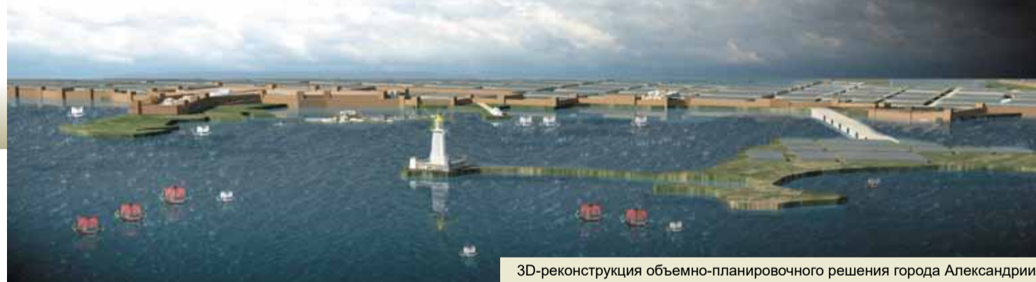
3D-реконструкция объемно-планировочного решения города Александрии

Также были представлены работы студентов старших курсов, которые отличались