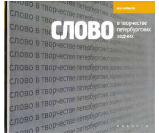
Обложка к книге Ю. И. Курбатова

Таким образом, особое место в преобразовании строго функциональных форм, как выявляют диалоги, займет совершенствование творческого процесса, ориентированного на поиск: синтеза рационального и чувственного, точ-