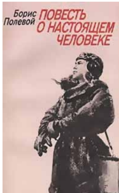
Обложка книги Бориса Полевого