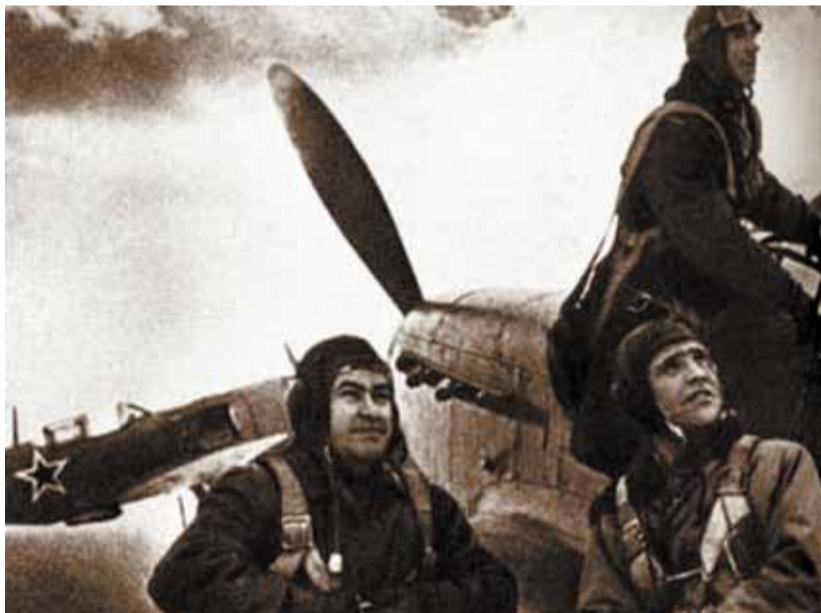
А. П. Маресьев (слева) среди боевых товарищей (на заднем плане его Ла-5ФН)