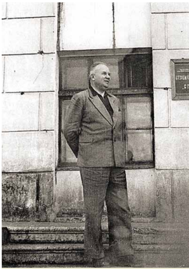
На крыльце треста «Апатитстрой», г. Апатиты