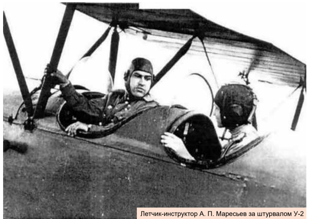
Летчик-инструктор А. П. Маресьев за штурвалом У-2

нанта, направив его на переподготовку в Ибресинскую 3-ю авиашколу первоначального обучения в Чувашии. В феврале 1943 года А. П. Маресьев начал снова летать и добился отправки на фронт. В июне 1943 года старший лейтенант Маресьев прибыл в 63-й гвардейский истребительный авиалек 3-й гвардейской авиационной дивизии 1-го гвардейского истребительного авиакорпуса 15-й воздушной армии, где получил новый Ла-5ФН (Фор-