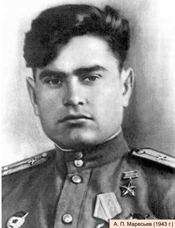
А. П. Маресьев (1943 г.)

Майский выпуск «календаря» памятных дат военной истории России целиком посвящен одному событию, значение которого для патриотического воспитания молодежи трудно переоценить. 20 мая — 100 лет со дня рождения Героя Советского Союза, летчика-истребителя Алексея Петровича Маресьева (1916–2001).