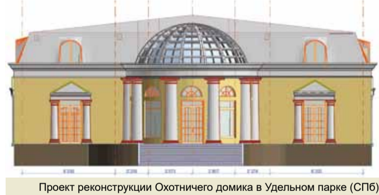
Проект реконструкции Охотничьего домика в Удельном парке (СПб)