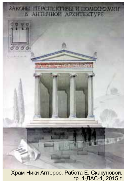
Храм Ники Аптерос. Работа Е. Скакуновой, гр. 1-ДАС-1, 2015 г.

Текст: Елена СКАКУНОВА, 1-ДАС-1 Фотографии: А. В. СИЛЬНОВ, старший преподаватель кафедры истории и теории архитектуры СПбГАСУ