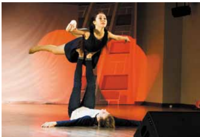
Десятый юбилейный сезон Всероссийского творческого конкурса «Звезда удачи» завершился. Для участников от СПбГАСУ он стал поистине звездным...

На протяжении двух месяцев ребята демонстрировали свои таланты зрителям и членам жюри. Все работы квалифицировались по 14 номинациям: «Музыка (инструментальное исполнение)», «Музыка собственного сочинения», «Вокал», «Танец», «ИЗО и декоративно-прикладное искусство», «Я — фотограф», «Театр», «Мода», «Экстрим», «КВН и STAND-UP COMEDY», «Литература», «Проектирование», «Кино», «Неформат».