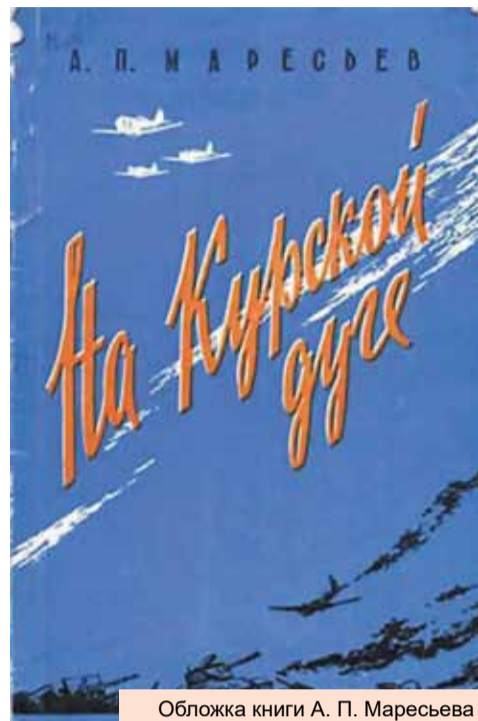
Обложка книги А. П. Маресьева

Итак, именно в районе Демянского котла, над контролируемой немцами территорией, и был сбит 4 апреля 1942 года лейтенант А. П. Маресьев. 18 суток раненый в обе ноги летчик провел в лесах и болотах. Двигаясь, преимущественно ночами, по компасу на восток, к линии фронта, вначале он шел на перебинтованных ногах, но после их обморожения, передвигался исключительно ползком. Растянув на несколько дней свой летный НЗ — «неприкосновенный запас», состоявший из плитки шоколада, пачки галет, пары банок консервов, а также фляжки со спиртом, — Маресьев перешел на подножный корм: кору и почки деревьев, а также грибы и ягоды из-под снега. Обнаруженный 22 апреля местными жителями деревни Плав Кисловского сельсовета Валдайского района, Маресьев пробыл больше недели среди колхозников. В первых числах мая раненый летчик самолетом был отправлен в один из московских госпиталей. Там у него обнаружили гангрену. По тем временам это был смертельный диагноз, но врачи сумели сохранить жизнь отважному летчику, ампутировав обе ноги в области голени. После госпиталя, в сентябре 1942 года Маресьев попал в санаторий на реабилитацию, где начал тренироваться ходить на протезах. В начале 1943 года он прошел медкомиссию, показав способность нормально ходить и даже прыгать. Командование пошло навстречу патриотическому порыву лейте-