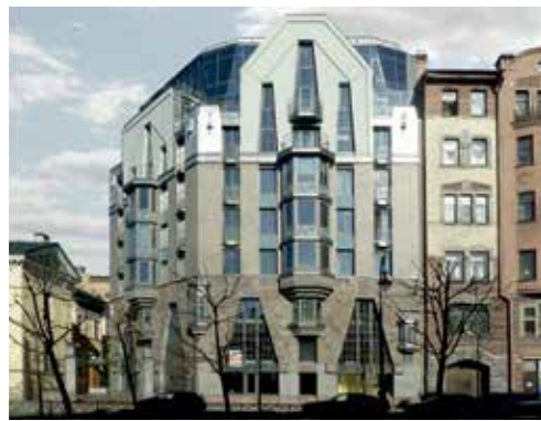
Здание на пр. Чернышевского, 4

Заслуженный архитектор России, академик архитектуры (действительный член РААСН и МААМ), член-корреспондент Российской академии художеств, вице-президент Санкт-Петербургского союза архитекторов