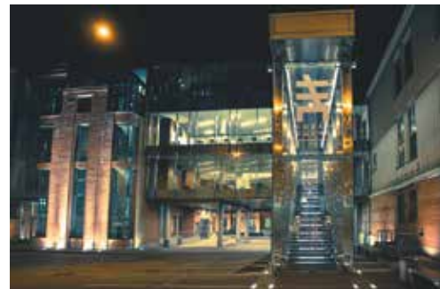
Новая сцена Александринского театра

Среди знаковых проектов своего архитектурного бюро архитектор называет «Невский Палас Отель», проект новой сцены Александринского театра (за который архитекторы получили Премию Правительства Российской Федерации, премию Правительства Санкт-Петербурга и награду «Хрустальный Дедал»), бизнес-центр и жилой дом в Зоологическом переулке, жилой комплекс «Космос», конкурсный проект международного аэропорта.