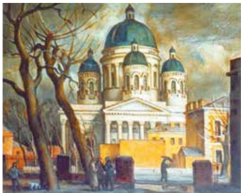
Пятахин Н.П. Поздняя осень. 1994