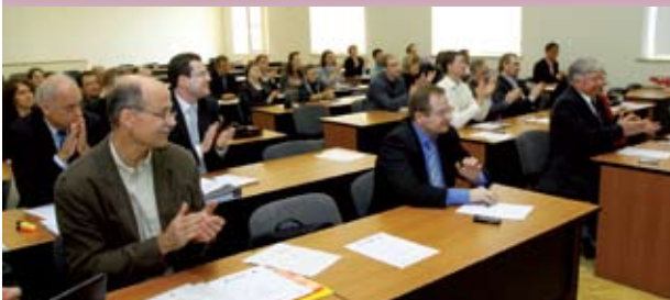
Продолжение. Начало на стр. 1.

В связи с этим своевременно запущен совместный проект под названием «Longlife», целью которого является объединение усилий стран Балтийского региона по оптимизации методов энергосбережения, сведение к минимуму эксплуатационных расходов на жилье, унификации подходов к проектированию энергоэффективных жилых зданий в регионе.