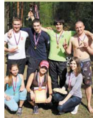
Команда «Космополитен» — 1-е место