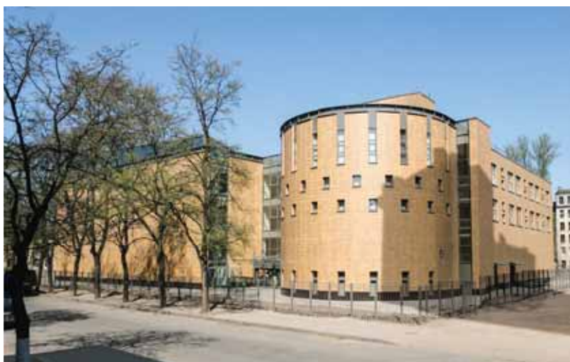
Еврейский общинный дом