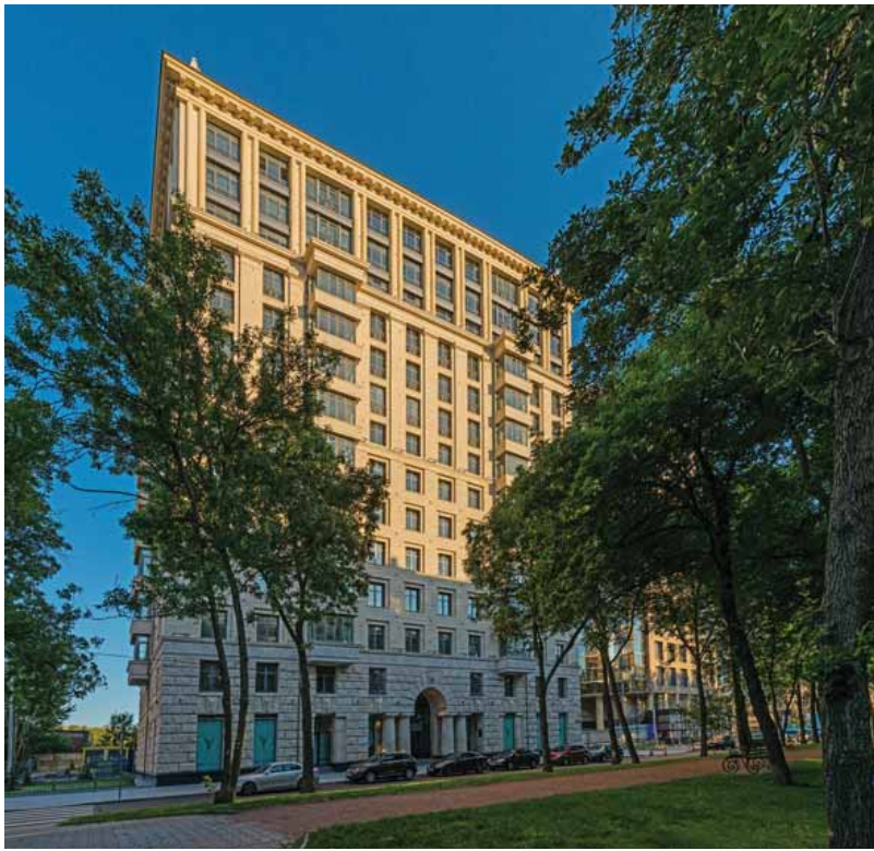
Дом на ул. Победы, 5

— Чтобы не быть нескромным, я опущу проекты нашей компании. Из того, что сделано коллегами, мне нравится дом на Казанской улице архитекторов Рейнберга и Шарова, дом Земцова