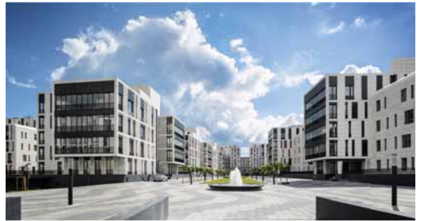
ЖК «Дом у моря»

проводить дороги. Необходимо обеспечить людей детскими садами, школами, магазинами. Чтобы не получилось, как в Мурино, — микрорайон построен, а проехать туда практически невозможно. Надо иметь желание и понимать, как этого добиться. То есть нужны воля, образование и кругозор.