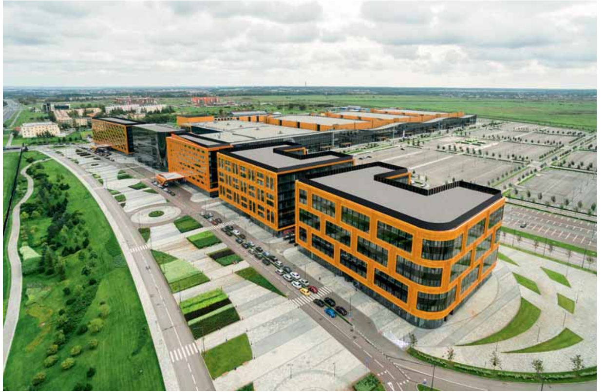
Конгрессно-выставочный центр в Шушарах