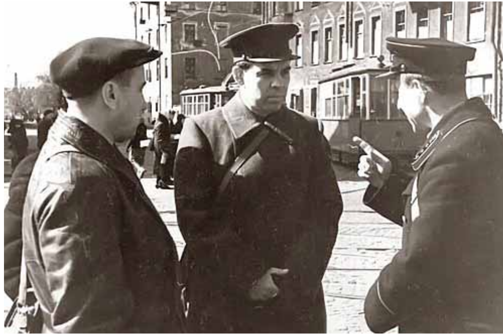
Петр Попков (в центре) во время беседы с работниками трамвайного парка. 1942 г.