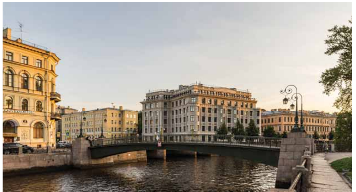
Жилой дом по наб. р. Мойки, 102