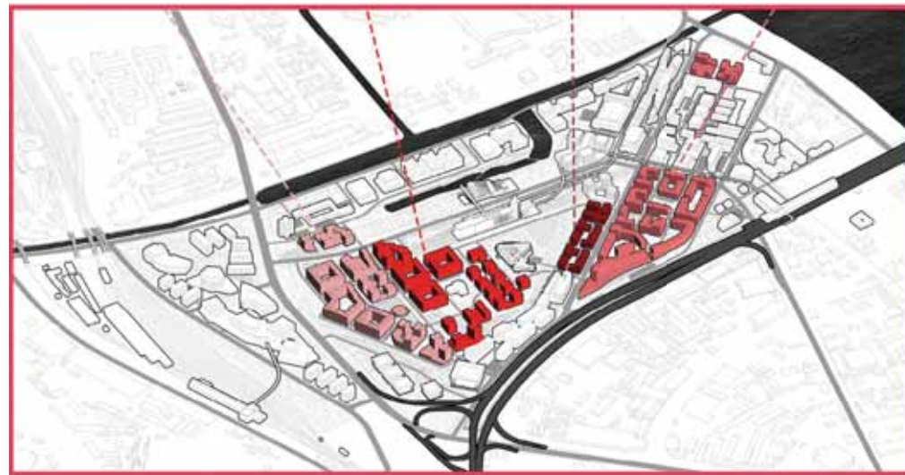
ВКР Дениса Красикова

ториями. От градостроителя требуется особое внимание к выбору структуры и масштаба новой жилой застройки, к созданию современной инженерно-транспортной инфраструктуры. Кроме того, в ВКР Дениса Красикова решаются задачи превращения