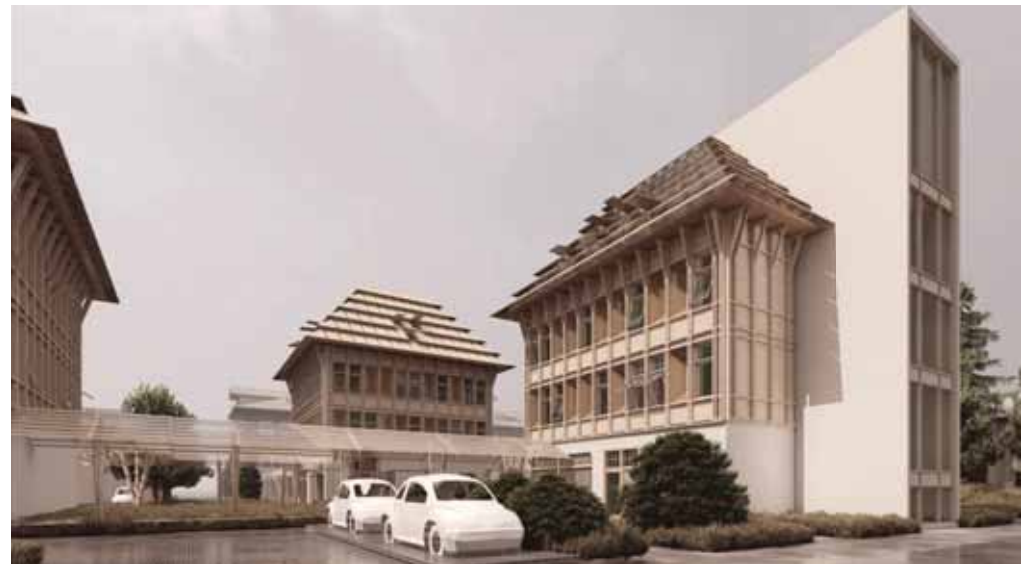
ВКР Никиты Искусова

туры, интегрированной с новыми зданиями. Для Сестрорецка характерны разнообразная перемежающаяся между собой застройка, сложный рельеф, и это необходимо учитывать. В границах проектирования остается часть существующей застройки как жилого, так и общественного назначения, на которую необходимо опре-