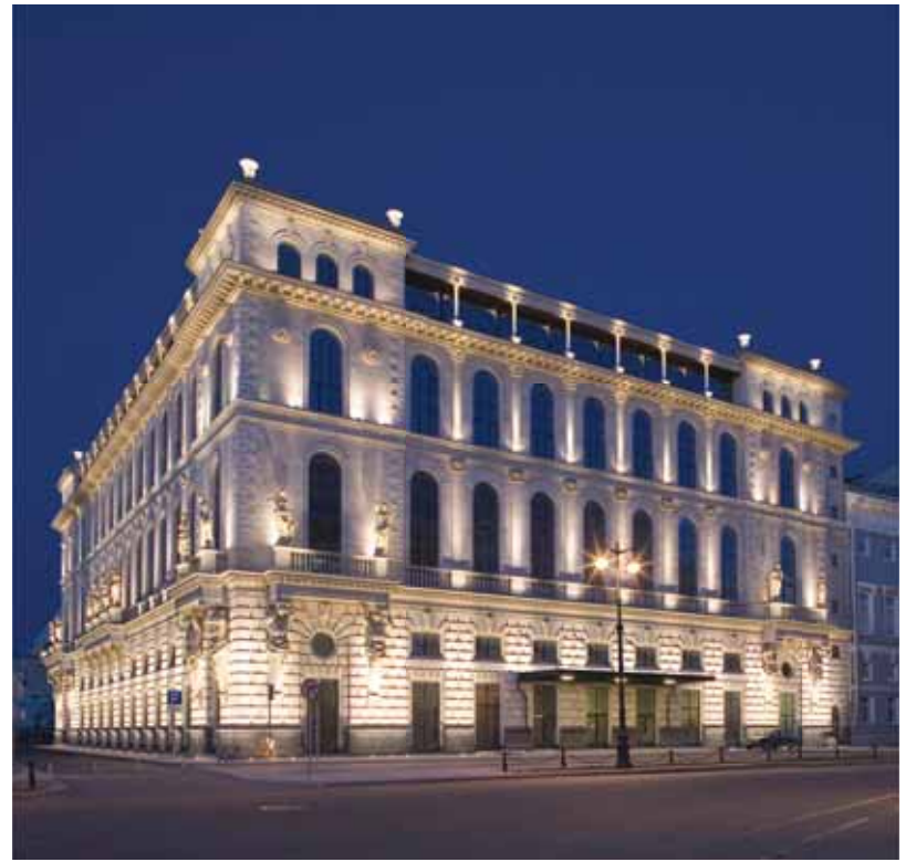
Дом на пл. Островского

— Да, это возможно, но для этого нужно желание городских и архитектурных властей. Можно снижать этажность, делать более комфортную для человека среду, снижать коэффициент застройки,