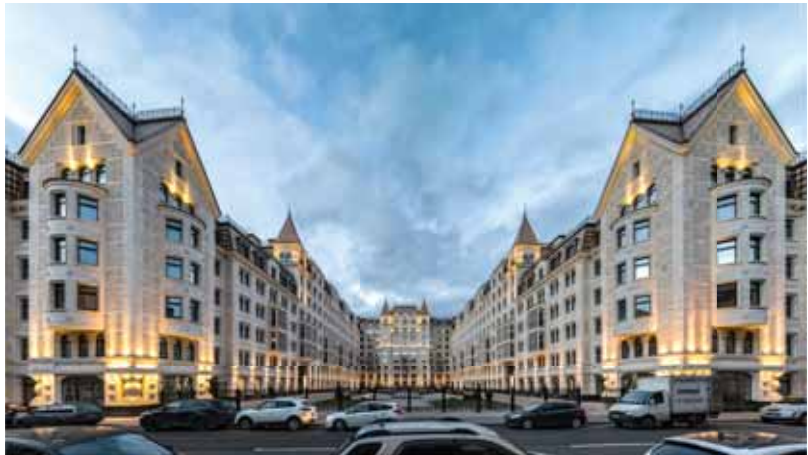
ЖК «Русский дом»

— В моей компании — пять партнёров. Все они закончили ар-